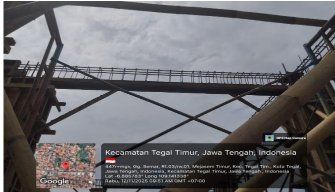
Gambar 2. Pekerjaan Pembesian Balok Beton Bertulang

Menunjukkan proses pemasangan bekisting balok menggunakan kayu dan multiplek sebagai cetakan beton sesuai dimensi rencana.