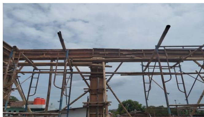
Gambar 1. Pemasangan Bekisting Balok Beton Bertulang