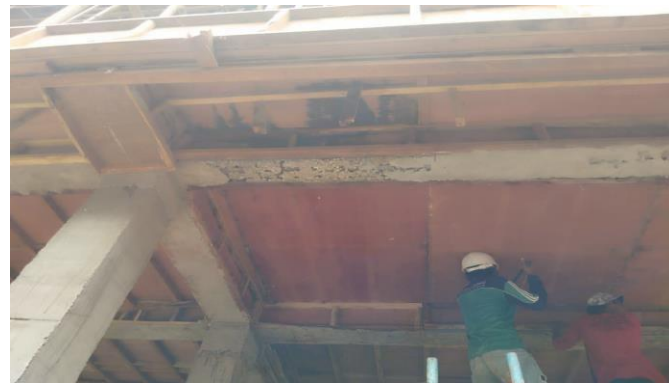
Gambar 4. Hasil Pekerjaan Balok Beton Bertulang

Pengecoran beton ready mix mutu K-250 pada balok beton bertulang menggunakan concrete pump.