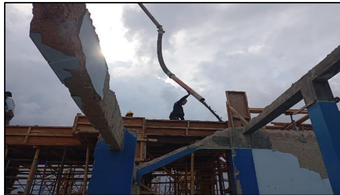
Gambar 3. Proses Pengecoran Balok Beton Bertulang

Perakitan tulangan utama dan sengkang balok sesuai gambar kerja sebelum proses pengecoran beton.